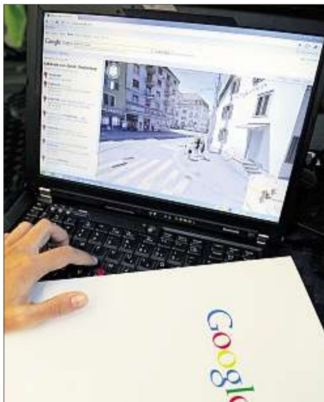
Bei den Aufnahmen für Google Street View hat der Internetkonzern private Daten aus drahtlosen Computernetzen gespeichert. (key)

Für das Angebot Street View werden ganze Strassenzüge fotografiert, die Ansichten anschliessend ins Internet gestellt und mit den jeweiligen Adressen verknüpft. Kritiker werfen dem grössten Suchmaschinen-Anbieter der Welt Übergriffe in die Privatsphäre vor. (sda/zl) Seite 12