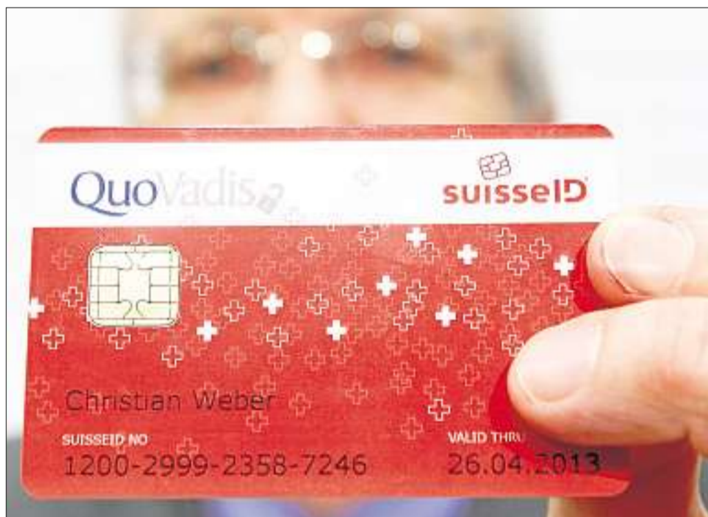
Bei Suisse ID handelt es sich um eine elektronische Unterschrift, die auf einem USB-Stick oder einer Chipkarte gespeichert ist. Dadurch entfallen bei diversen Online-Diensten Benutzername und Passwort. (key)

Glärnischstrasse 10 8810 Horgen 043 244 10 10